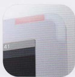
360度声光 双重三级报警 功能