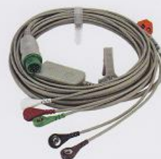
12 pin 5导心电图电极线