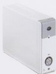
二氧化碳模块 (主流/微流)