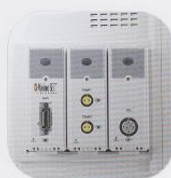
主机模块化 多参数 设计，3个扩展模块插槽， 支持多达11个参数同步测量