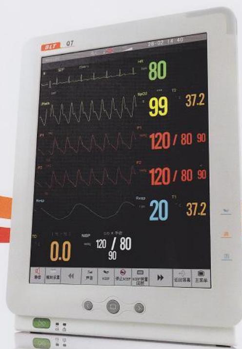
Q7 重症插件式监护仪