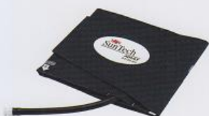
SunTech成人无创血压袖带