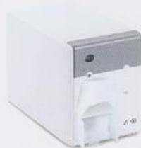
二氧化碳模块 (旁流)